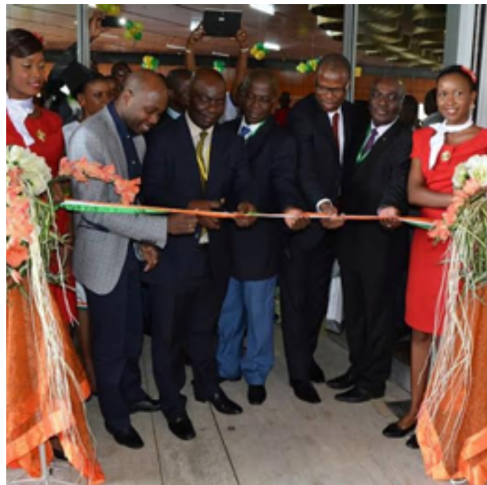
1ère édition CONTACT EXPO 25 et 26 Mai 2015

Il sera aussi l'occasion d'ouvrir de nouveaux marchés et de tisser des partenariats internationaux dans un format incluant rendez-vous d'affaires qualifiés, formation, conférences/débats, exposition diner gala et remise de prix.