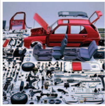
قطع غيار السيارات