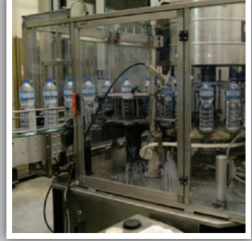
ماكينات تصنيع البلاستيك