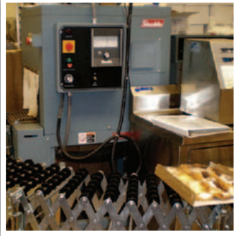
ماكينات إنتاج الأطعمة