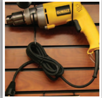
أجهزة و أدوات