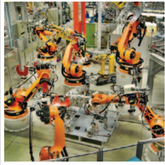
معدات و ماكينات الكثوية و كهربائية